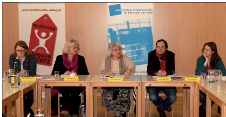
Pressekonferenz am 27. November 2014

der Wohnungssuche benachteiligt fühlten. Inwieweit bei der Wohnungsvergabe durch das Wohnungsamt in der Stadt Salzburg Diskriminierung eine Rolle spielte, konnte nicht geklärt werden. Von Seiten der AD-Stelle wurden die KlientInnen über das Vergabesystem aufgeklärt und eine Vernetzung mit zuständigen Stellen forciert.