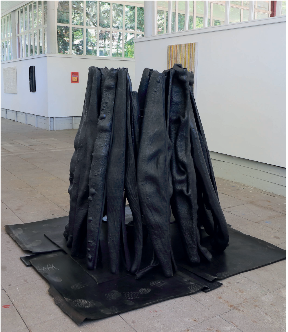
Peter Hartl Volcano , 2021