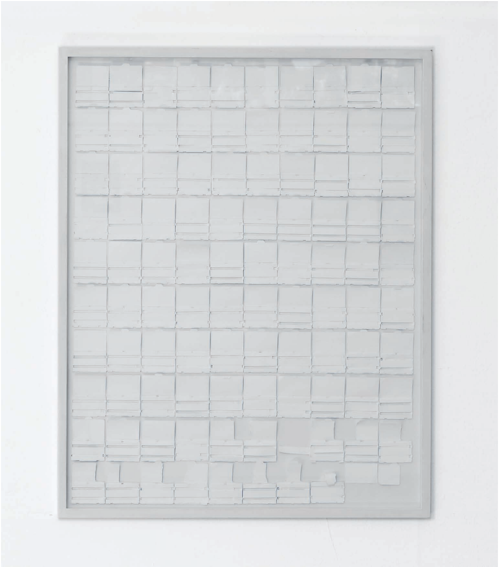
Oliver Riedel Conversation Piece 2016-21, 2021