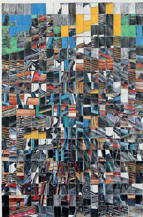
Oliver Riedel Ohne Titel kein Ende , 2021