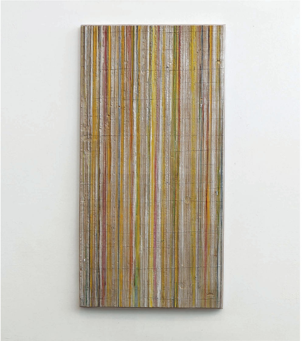
Peter Hartl Grosser Anstrich , 2019