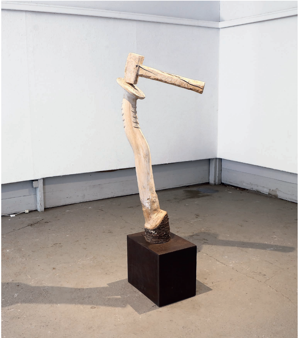
Peter Hartl Der Hammer , 2013