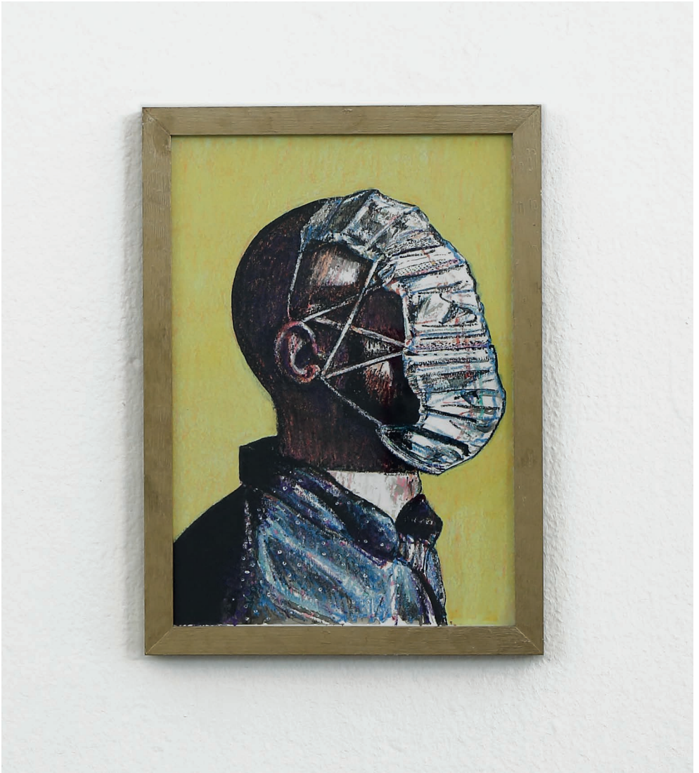
Oliver Riedel Selbstporträt als pflichtbewusster Bürger, 2020