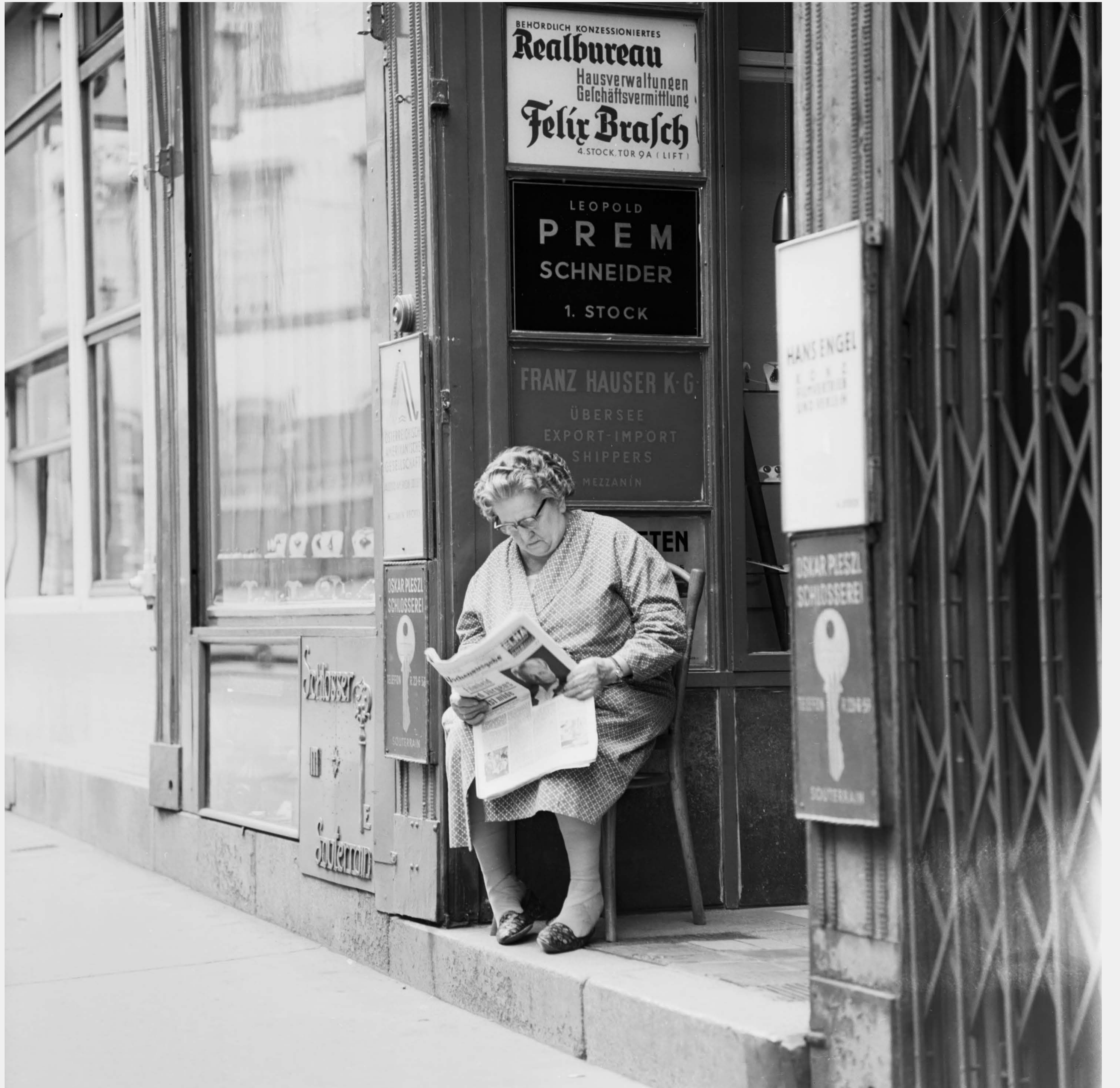
Foto: Harry Weber, Datierung: 1960. © ÖNB, Wien, Bildarchiv (Inventarnummer HW1960_1152_4_2_12)