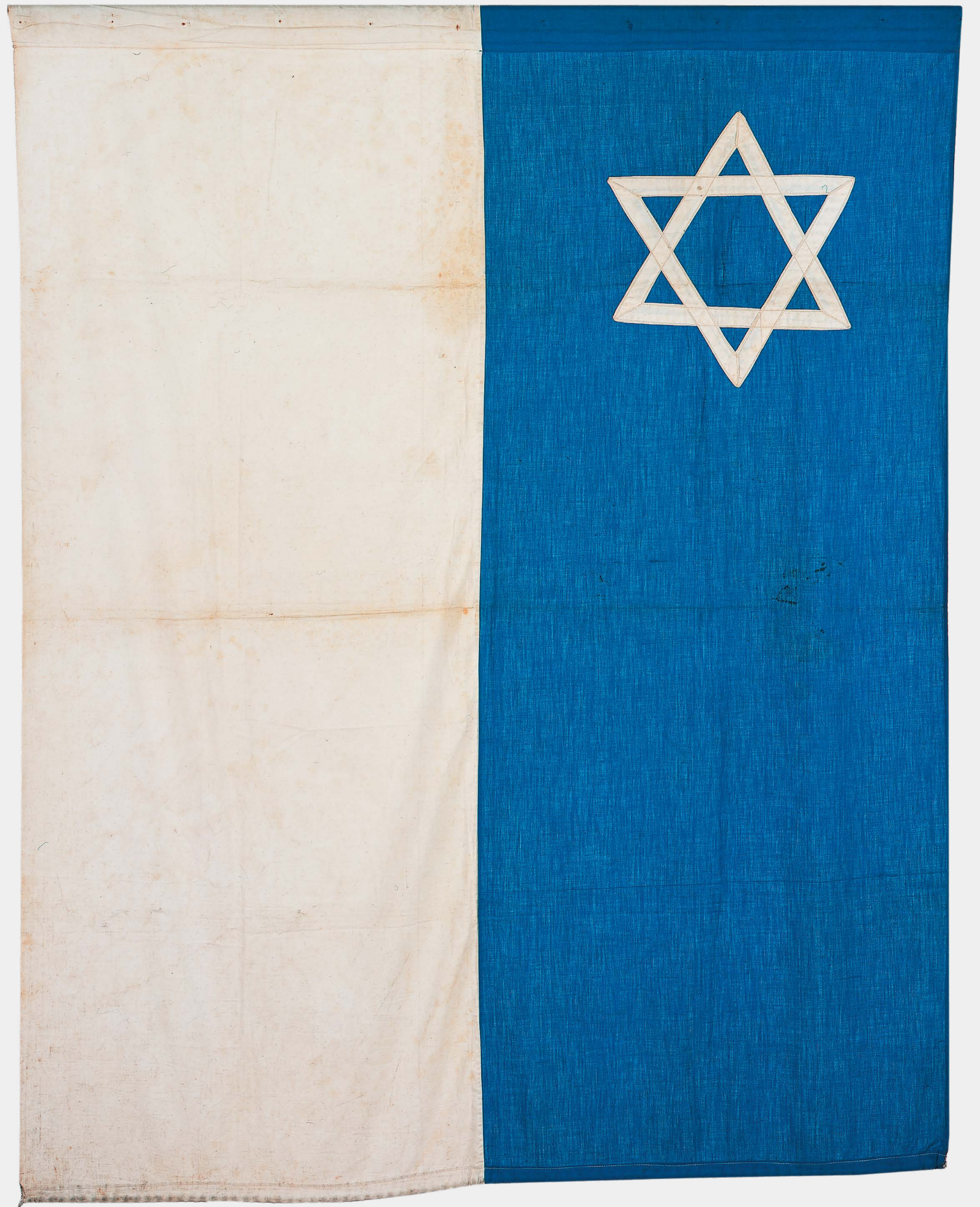
Martin Friedländer, Fahne mit Davidstern, Berlin September 1935, Jüdisches Museum Berlin, Schenkung von Martin Friedländer