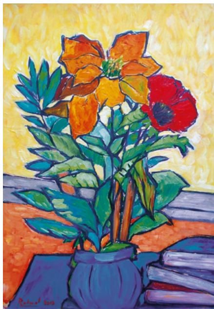
ROLAND, Frühling , Öl auf Malkarton, 2013, 70×50 cm

Kunstmesse WIKAM in Wien, Palais Ferstel 8.–16.3.2025