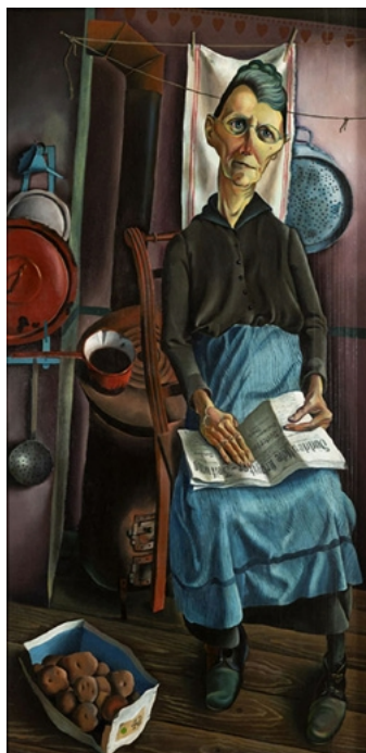
Unbekannt, Mutter in der Küche , nach 1926, Öl auf Holz, 120×62 cm