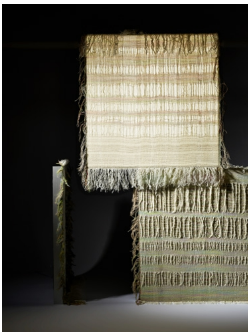
Sanja Lulei, Perceptions