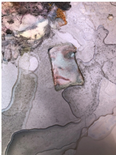
Alex Grein, Speicher , 2021, Prints, Eisblöcke, Tablet- und Smartphone-Halterungen, Edelstahl-Auffangwanne, Edelstahl-Gestell, Kanister