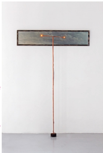
Jacqueline Mesmaeker, L'Androgyne, 1. Avion en phase d'approche , 1986–2013, Mixed media

Slice of Life. Von Beckmann bis Jungwirth 14.3.–19.10.2025