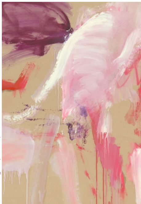
© Martha Jungwirth / Bildrecht, Wien 2025