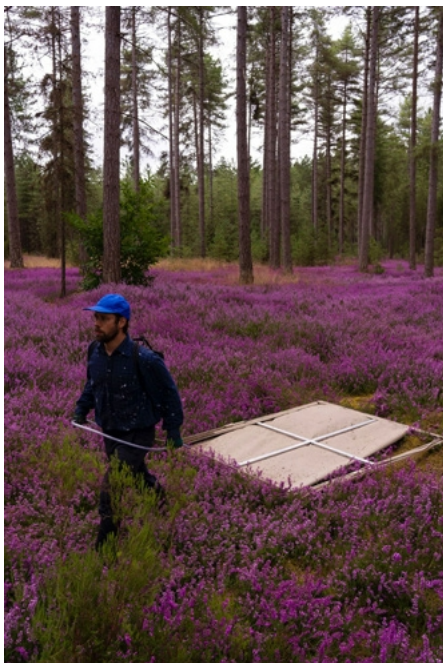
Sequenz aus David Roths Video Le Pré de l'Orme , 2024, dokumentiert von Claire de Foucoud