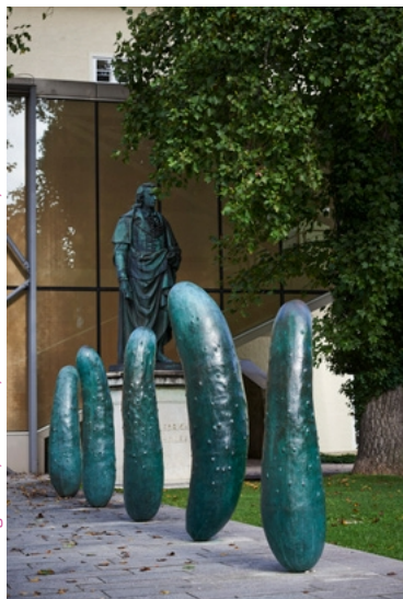
Erwin Wurm, Gurken , 2011