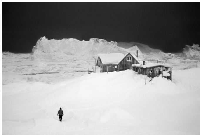
Ragnar Axelsson, Inuit-Jäger in Tiniteqilaq , Grönland, 2015, Archival pigment Print auf Alu-Dibond, Edition 10+2AP, 90×60 cm

DER MOMENT MACHT DAS BILD – 10×10 Edition Eine Gruppenausstellung 10 Salzburger Leica FotografInnen 10.4.–12.7.2025