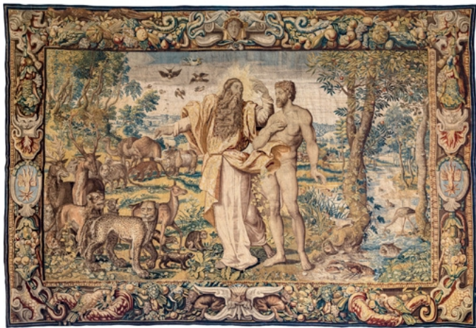
Gott entlässt Adam ins Paradies, 2. Viertel 17. Jh.