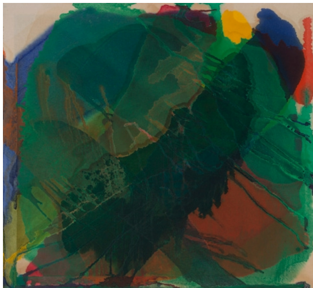
Gottfried Mairwöger, Ohne Titel , Öl auf Molino, 97,5×107,5 cm

Im Erdgeschoss: Salzburg Museum Gastspiel Rudolf Hradil – Zum 100. Geburtstag Im 1. Stock: Eva Möseneder 7.6.–12.7.2025