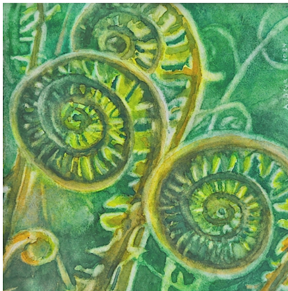
Andrea Lacher-Bryk, Farne , 2024,

Aquarell auf Hahnemühle Torchonpapier, 100×100mm