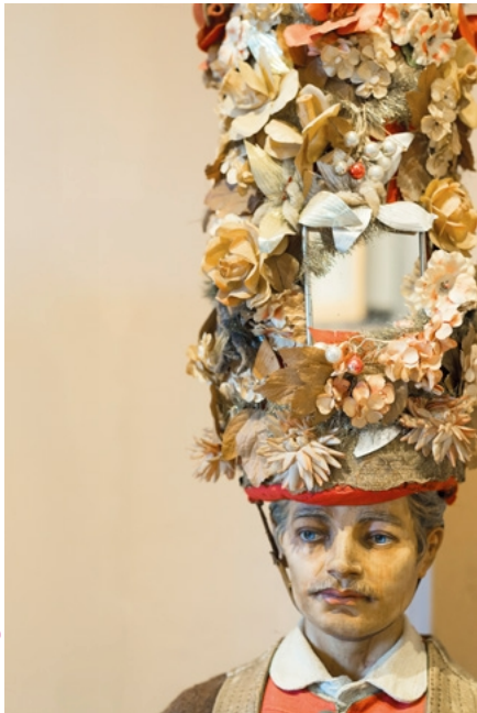
Pongauer Schönpercht (Gasteiner Turmpercht), 1. Hälfte 20. Jh.

Masken, Trachten, Kultobjekte. Volkskundlich sammeln? 29.3.-2.11.2025