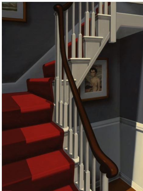
Kenton Nelson, Downstairs , 2024, Öl auf Leinwand, 102×76 cm