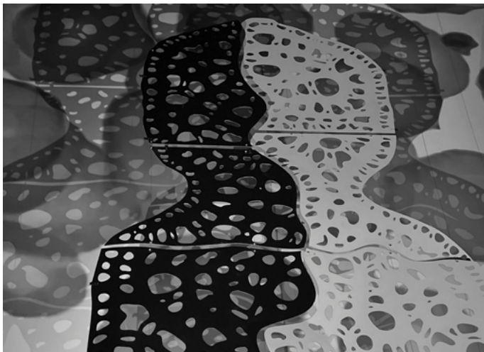
Eva Petrič, Earthling , 12-teiliges Aluminiumobjekt, 9,5×4 m, Detail

Marianne Ewaldt WHITE MAZE Nr. 0 Buch-Labyrinth 23.5.-9.6.2025