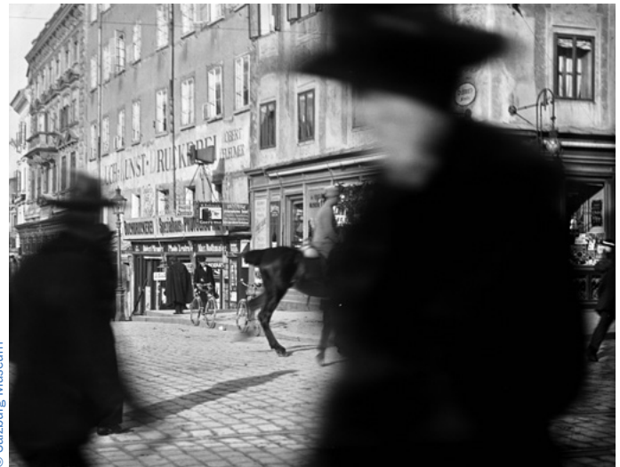
S/W Fotografie, Fotograf*in unbekannt, Salzburg, Ecke Schwarzstraße/Platzl, Inv.-Nr. GP 3038-49