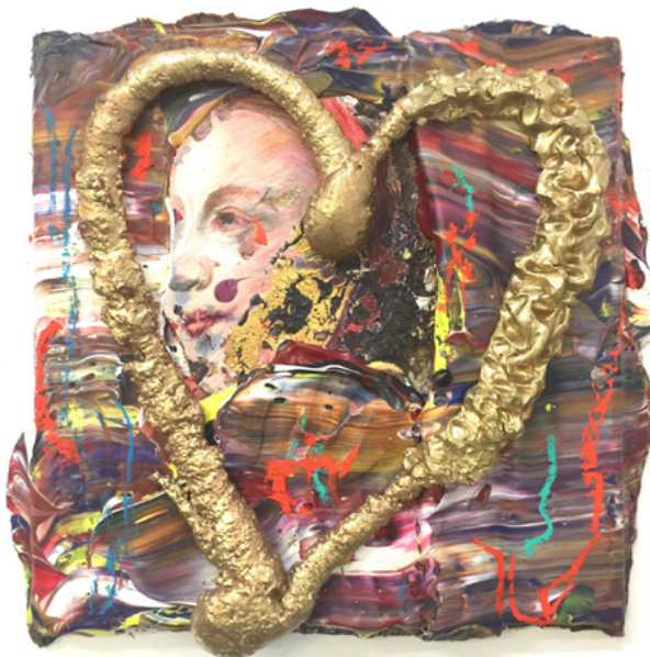
Stefan Heizinger, Veränderungen lieben , 2023, Farbe, Stifte, unterschiedliche Materialien auf Leinwand, etwa 55×55×6 cm

Max Blaeulich – ausgeschrieben 6.9.–5.10.2024