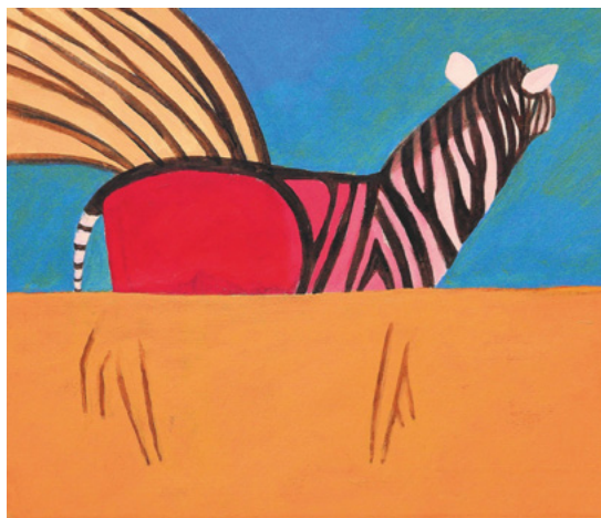
Lothar Schörg, Das einflügelige Zebra-Pegasus