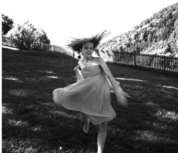
Regina Rieder, Die eigenen Grenzen sind überwunden , Fotografie, 50×70 cm