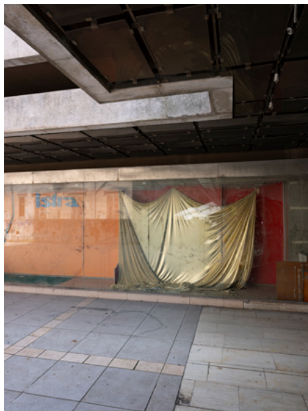
Werner Feiersinger, ohne Titel , 2022