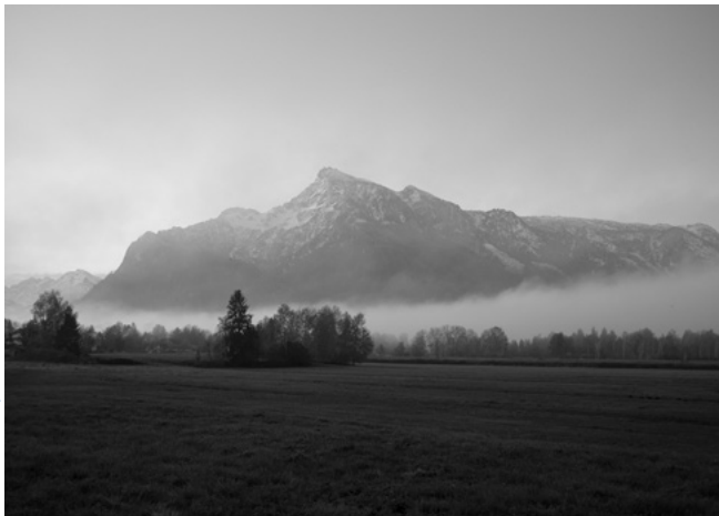
Andrew Phelps, Untersberg Sketches , 2020–2024, C-Print, 53 × 75 cm

Rinaldo Invernizzi & Andrew Phelps Dialogue: Reflecting Landscapes 30.1.–25.5.2025