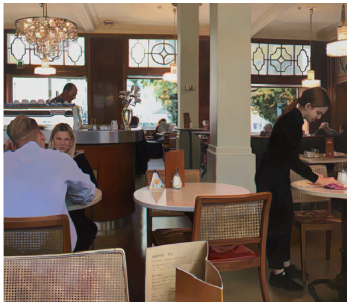
Kate Waters, I'll see you when I get there , 2024, Öl auf Leinwand, 150×170 cm