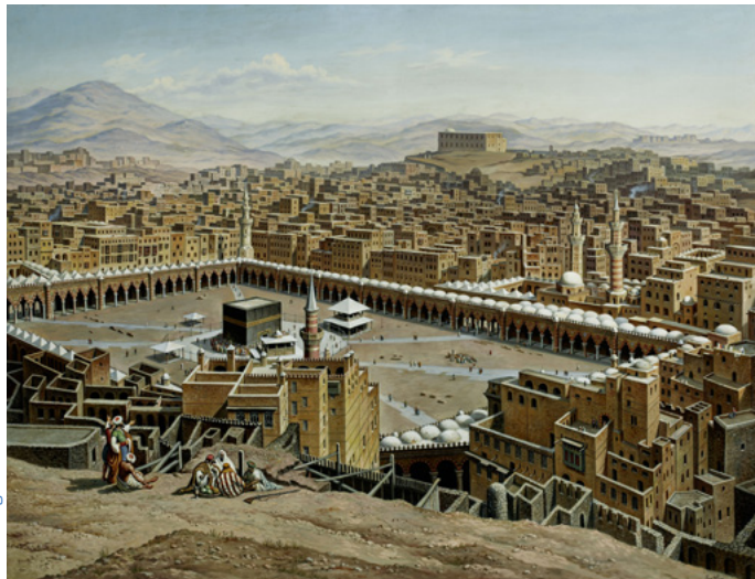
Hubert Sattler (1817–1904), Mekka mit Heiliger Moschee und Kaaba (Saudi-Arabien), 1897, Öl auf Leinwand