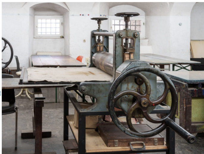
Grafische Werkstatt im Traklhaus

In Kooperation mit dem Salzburg Museum 21.2. 2024–3.5. 2025