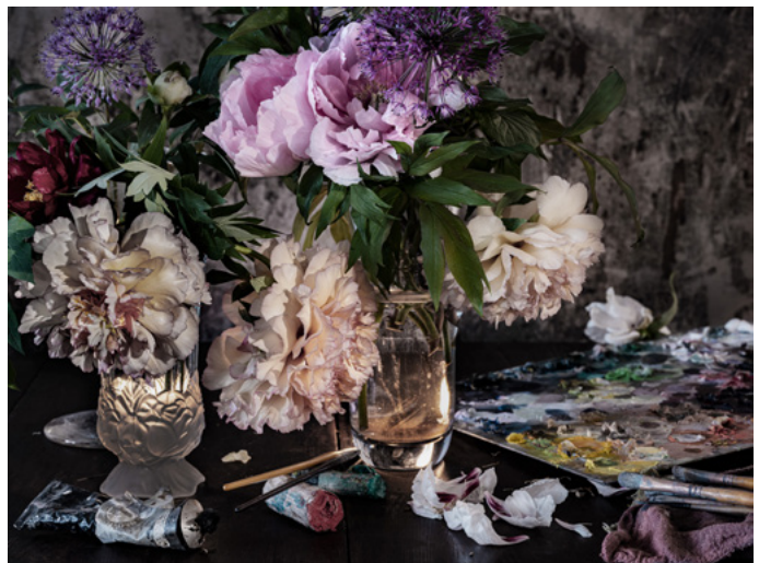
Vera Mercer, The Painter , 157 × 209 cm, Fine Art Print, limitiert und signiert

Kunst der Stille Porträts und Stillleben von Vera Mercer 15.11.2024 bis Februar 2025