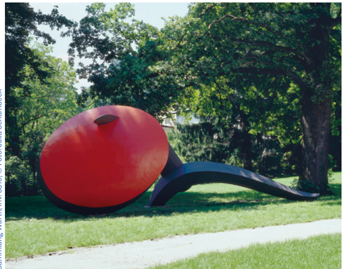
Sammlung Würth, Inv. 5319, © Foto: Julia Schambeck