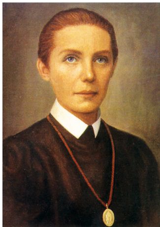
Maria Theresia Ledochowska