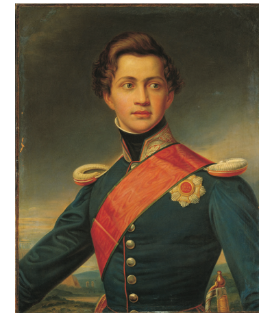
König Otto I.