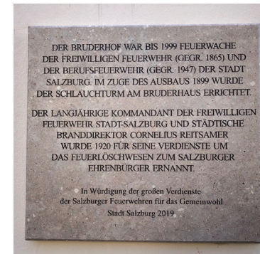
Gedenktafel der Feuerwehr