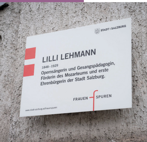
Frauenspuren“- Tafel Lilli Lehman