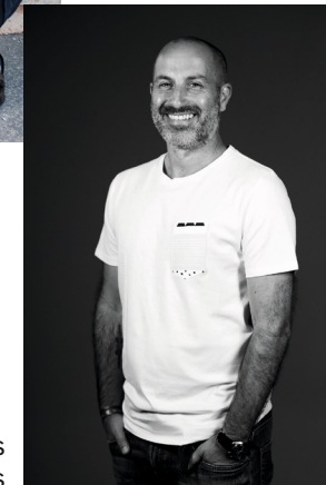
Christian Obojes © Christian Obojes