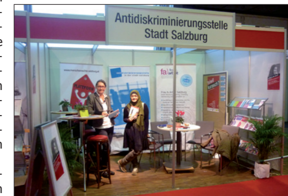
Informationsstand Berufsinformationsmesse 2014

Die Mitglieder der Arbeitsgruppe werden sich weiterhin für strukturelle Maßnahmen einsetzen, um neben der Sensibilisierung und Aufklärung von Betroffenen auch bei ArbeitsmarktakteurInnen, bei MitarbeiterInnen in der Lehr-